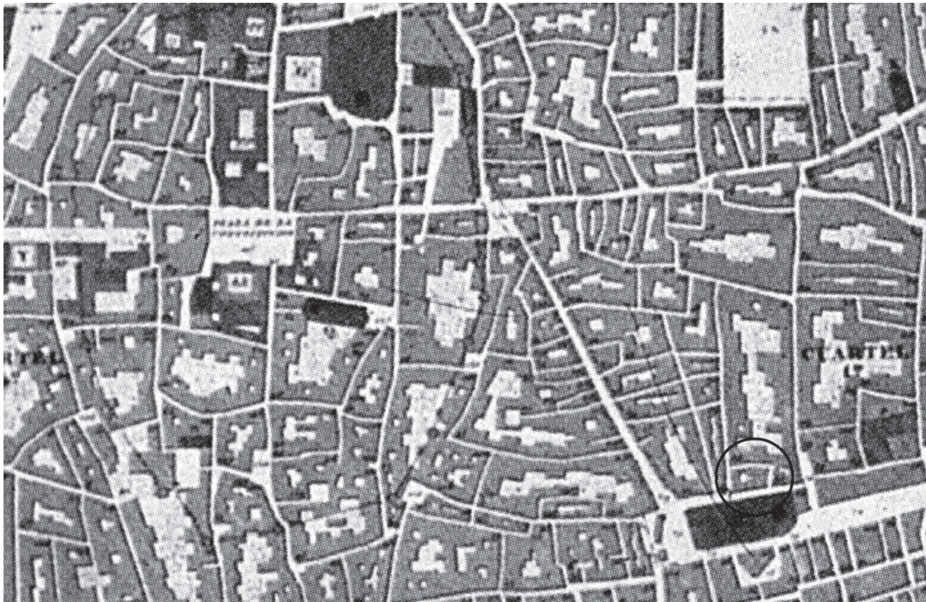
Figura 5. Detalle del plano de Barcelona del año 1842 dibujado por Josep Mas i Vila. En el ángulo inferior derecho se observa la antigua forma ligeramente curva de la calle Sant Antoni dels Sombrierers. Esta traza estaría señalando un fragmento del límite exterior del anfiteatro.

comprobable, como se ha comentado anteriormente, y que curiosamente los planos actuales no recogen. Cabe destacar también de este plano la curvatura que parece coger la calle Sant Antoni dels Sombrierers (fig. 5), curva cuya desaparición se puede atribuir a la remodelación moderna —posterior al plano— de los edificios que conforman esta calle. Por otro lado, en los planos de 1858 de Ramon Alabern y en el de 1862 de Francisco Coello y Maurici Sala se señala otra curva conformada por la línea de fachada de las casas de la calle Sombrierers antes de llegar a la calle Argenteria, curva que actualmente dibuja una anomalía con forma ligeramente angulosa en el trazado recto del resto de fachadas de la calle.