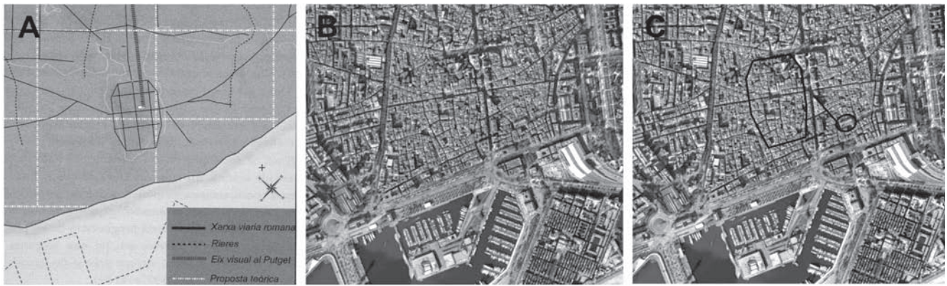
Figura 8. Situación del anfiteatro de Barcelona respecto a la ciudad y su centuriación: A) Detalle de la centuriación de la ciudad y red viaria (según Palet, Fiz, Orengo 2009: 119); B) Vista aérea de la zona de la ciudad romana; C) Vista aérea con indicación de la ciudad romana, la vía romana identificada en la centuriación propuesta por Palet, Fiz y Orengo (calle Argenteria), e hipótesis de ubicación del anfiteatro.

retícula teórica 36 y, lo que es más importante, esta organización o centuriación se ha fechado en la época fundacional de la colonia: por ello si el trazo de la actual calle Argenteria es augusteo, el planteamiento de un anfiteatro en el lugar también.