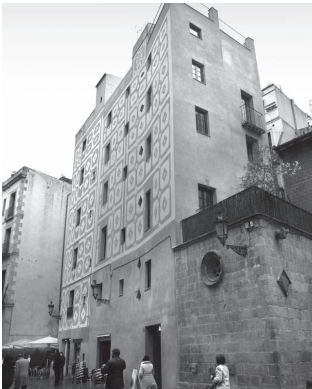
Figura 4. Edificio de la plaza Santa María, n. 7. Nótese la anómala curvatura de la fachada.