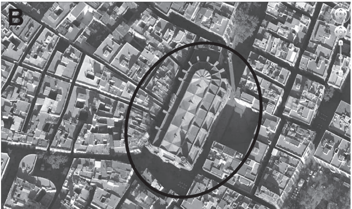
Figura 6. A) Rastros del posible anfiteatro de Barcelona en el urbanismo de la ciudad. En línea continua, las trazas del urbanismo actual; en discontinua, trazas reflejadas en planos del siglo XIX. B) Hipótesis de los límites exteriores del anfiteatro a partir de las trazas urbanas.