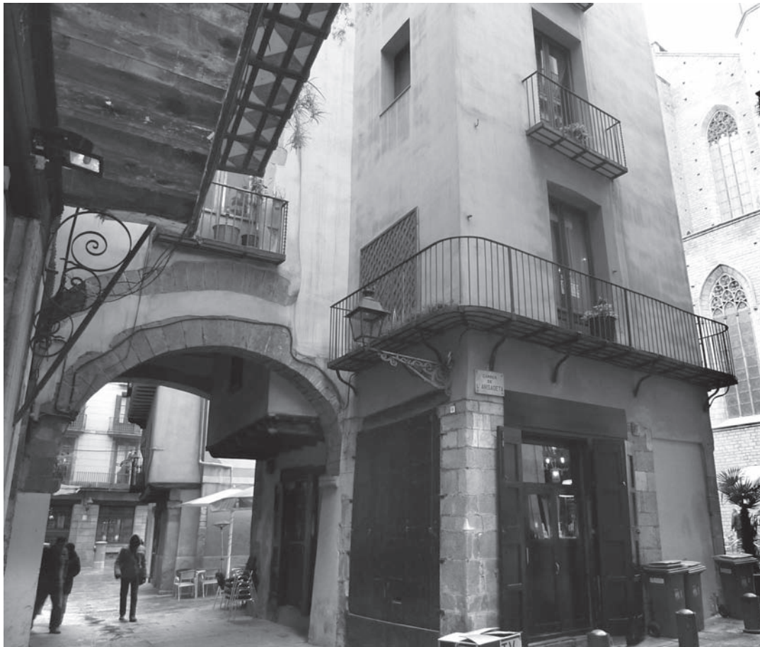
Figura 7. Arcos y estructuras abovedadas en la calle Caputxes.

calle, y bóvedas dels Encants, también desaparecidas, en la calle del Consolat del Mar; 33 aún en pie: dos bóvedas en la calle Arc de Sant Vicenç, dos bóvedas en la calle Volta dels Tamborets, una bóveda en la calle Caputxes, una bóveda en la calle Volta d'en Bufanalla, y otra en la calle Volta d'en Dusai. Es cierto que en otros puntos del casco antiguo de Barcelona se ha conservado bóvedas, pero no con la densidad que presentan las aquí expuestas. A ello se suma la noticia de galerías a modo de puente que circulaban entre Santa María y sus alrededores y que aún eran visibles a principios del siglo xx. 34 Si bien es conocido que estas bóvedas, galerías, arcos y puentes son propios del urbanismo de la Baja Edad Media, su especial concentración en la zona que estudiamos debe ser valorada en relación a la hipótesis que se está planteando, por lo que no se debería descartar la posibilidad de un origen antiguo para alguno de estos elementos arquitectónicos; 35 el