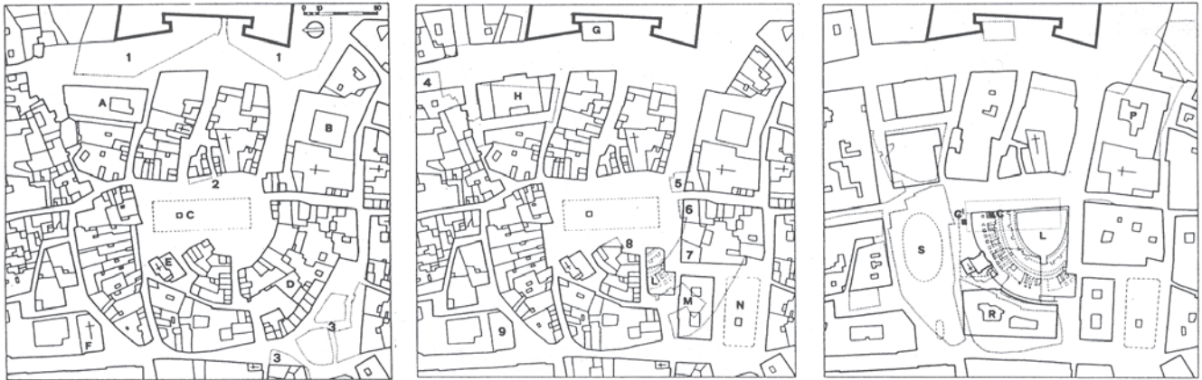
Figura 2. Plaza de S. Oronzo, en Lecce (según Fagiolo-Cazzato, en Cazzato 2000: 43). Su actual trama urbana, con claros indicios de radialidad, delataba la presencia de un anfiteatro.