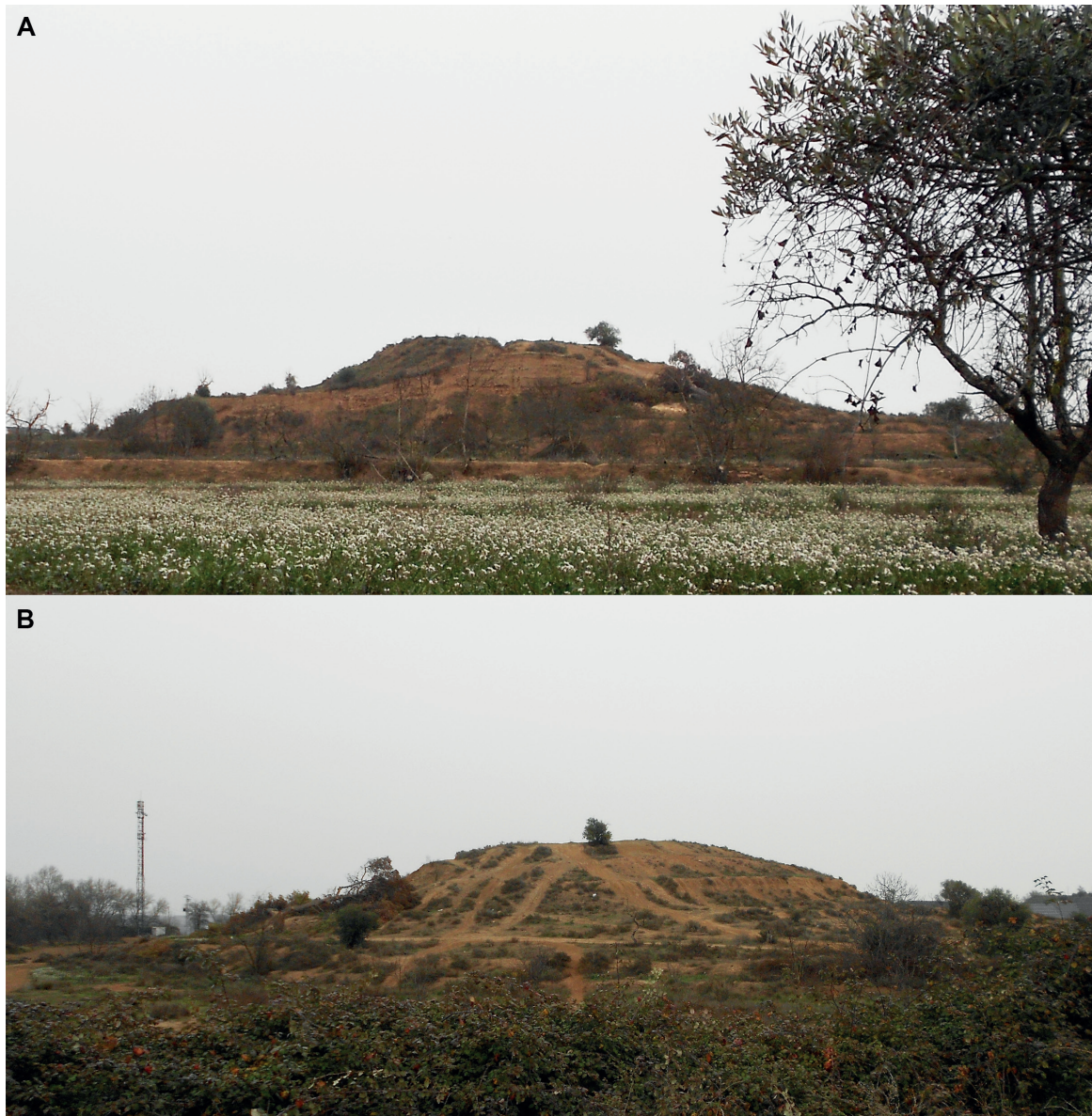
Figura 2. Vistes del Tossal de la Sal (Juneda). A. Vista des del nord; B. Vista des del sud-oest.