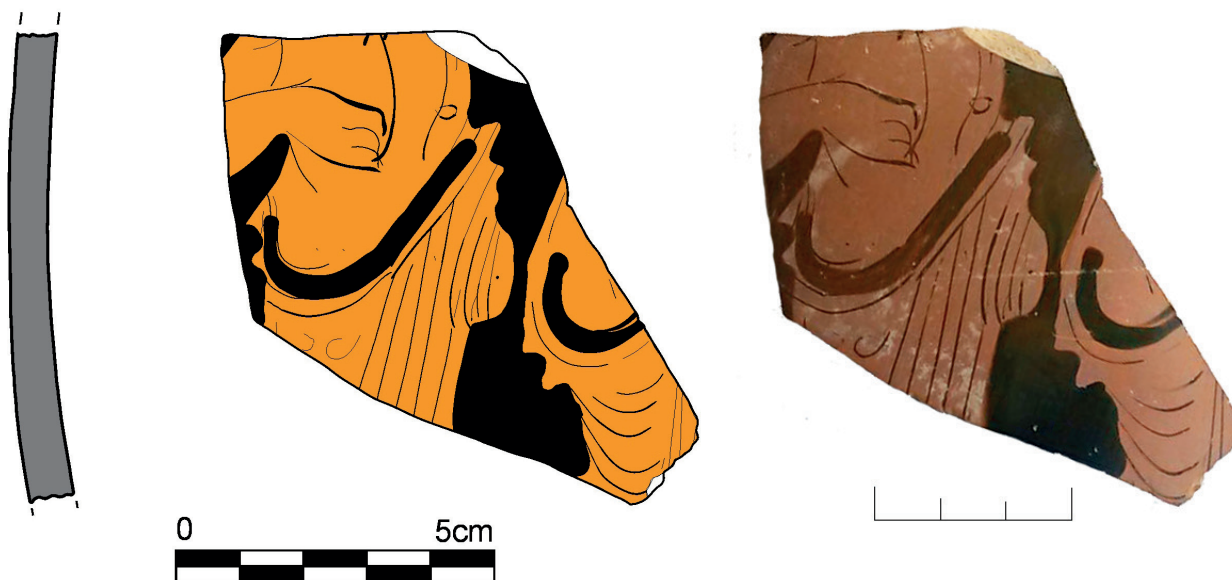
Figura 3. Fotografia i dibuix del fragment de cràter de figures roges atribuït al Grup del Pintor de Telos. Dibuix: I. Garcés.