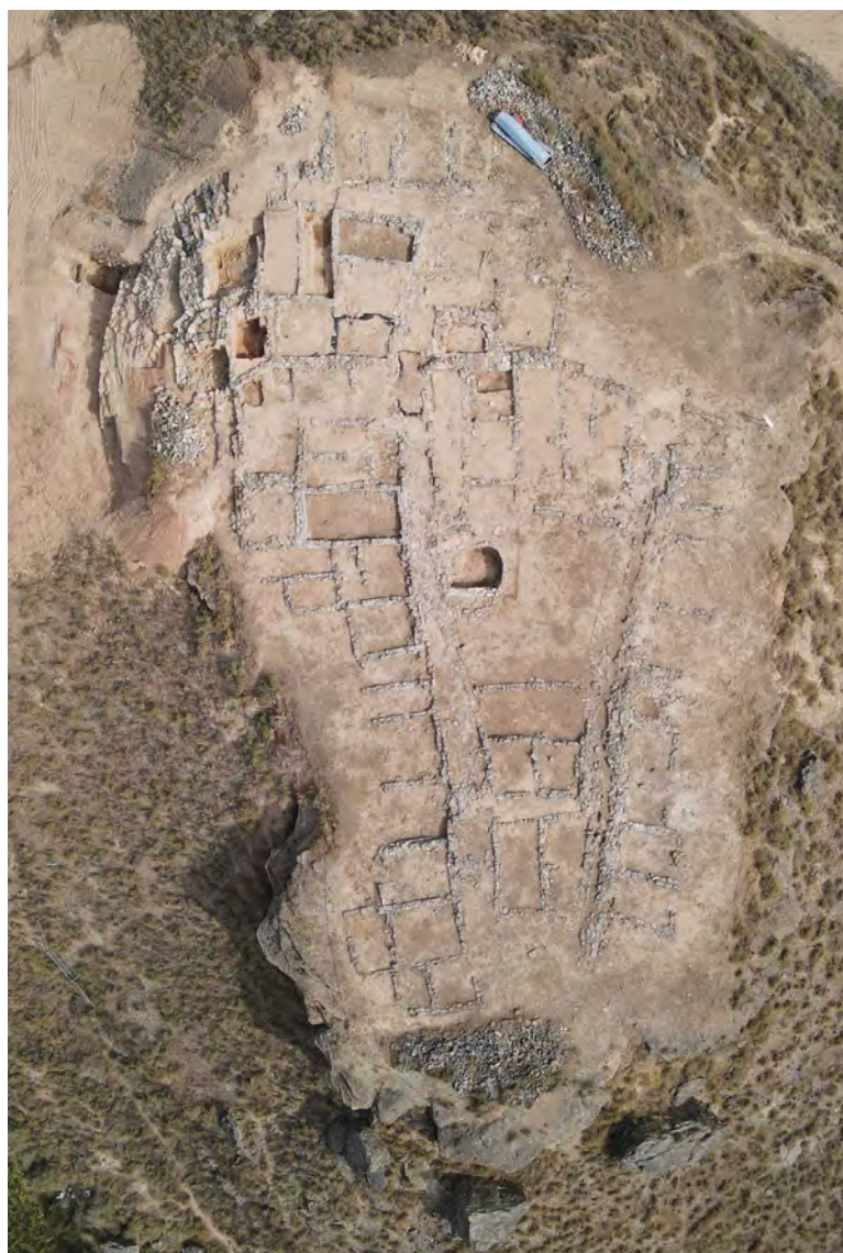
Figura 21. Gebut, Soses, des de l'aire. A la part superior esquerra, la zona intervinguda 2017-2020; al centre, la bassa.