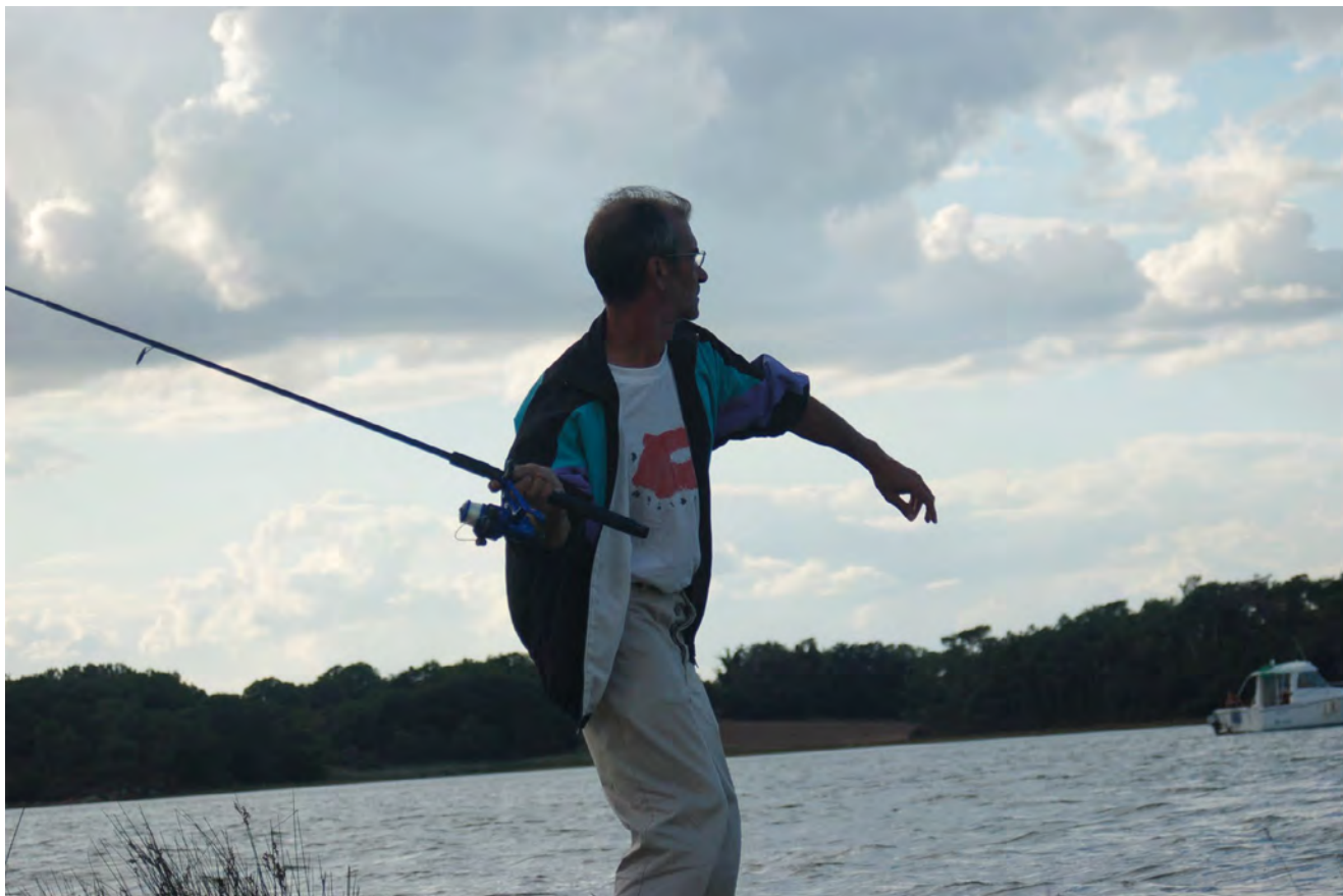
Figura 30. Pesca a Bretanya, 2005.