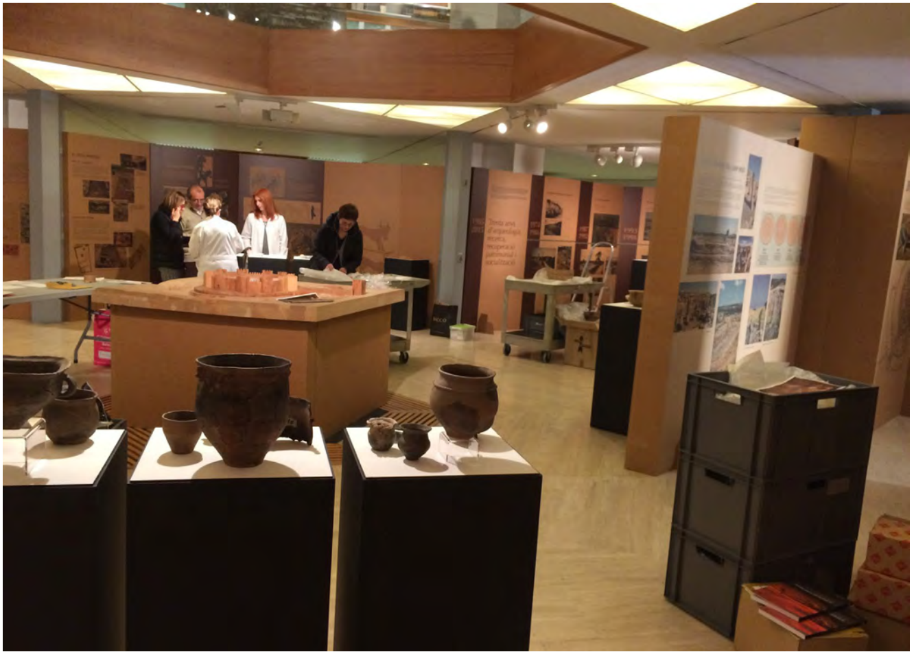
Figura 27. Muntatge de l'exposició "La Fortalesa dels Vilars d'Arbeca. Terra, aigua i poder en el món iber" al Museu d'Arqueologia de Catalunya. Febrer 2017.