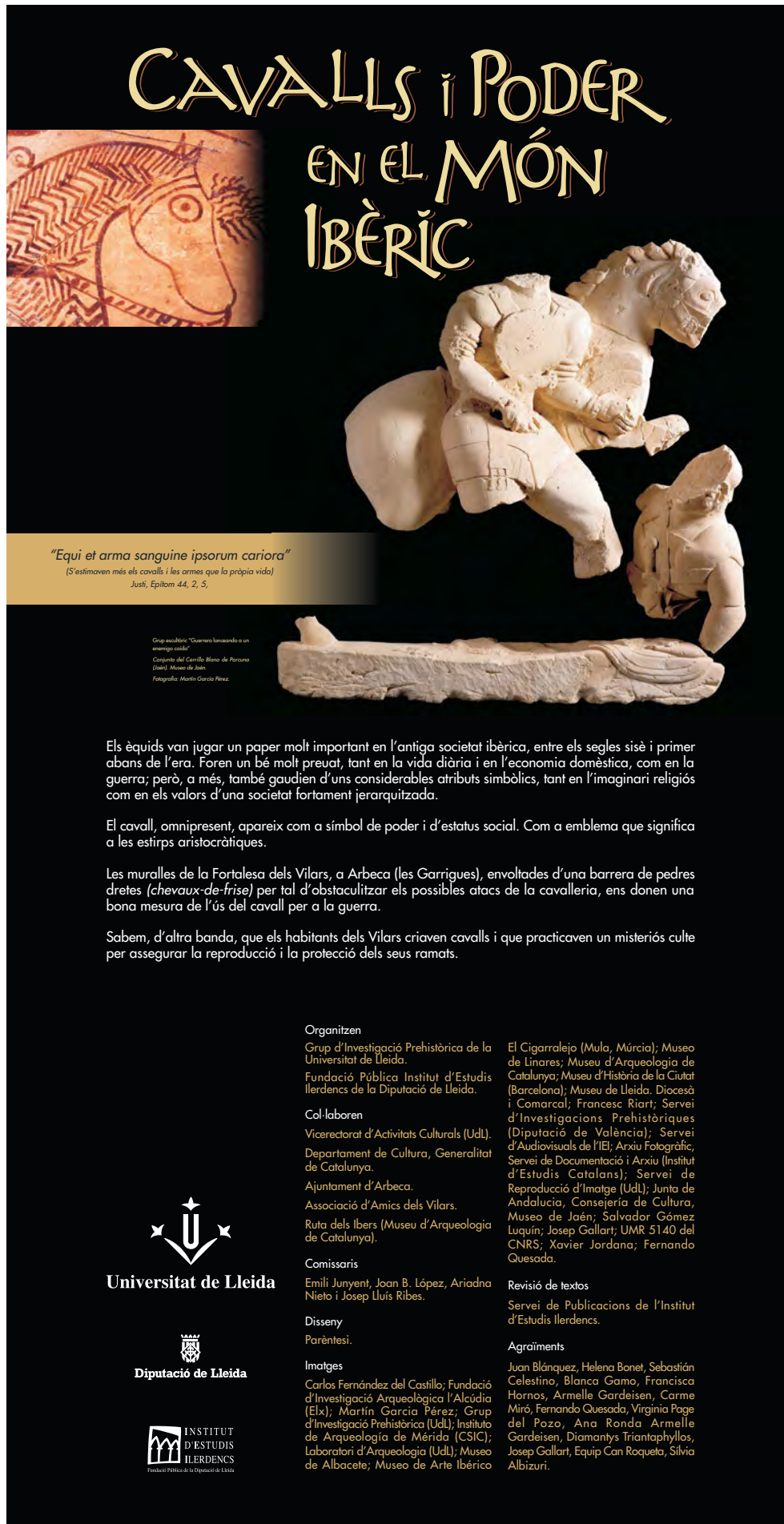
Figura 25. L'exposició "Cavalls i poder en el món ibèric" s'exhibí entre 2009 i 2018, en diferents formats, en vint-i-nou localitats, des de Gandia, País Valencià, fins a Arles, Bouches-du-Rhône, França.