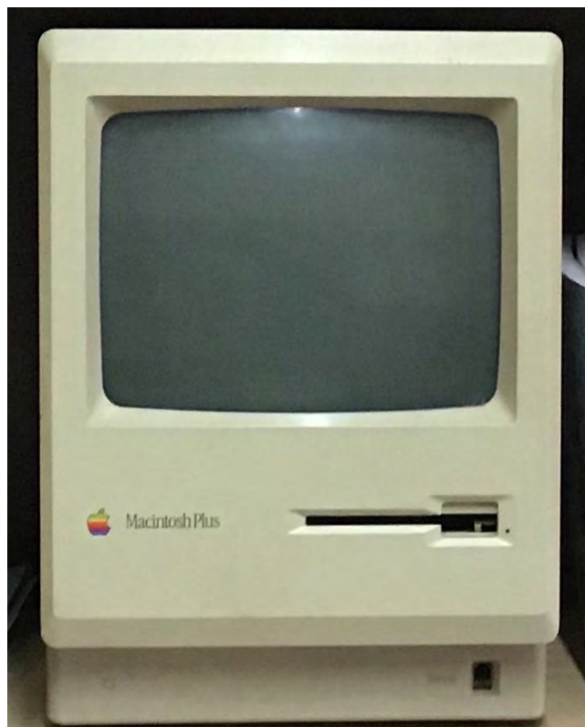
Figura 7. En 1986, Apple llançà al mercat el Macintosh Plus. Eren els anys de la poma mossegada multicolor i "amb ell va començar tot".