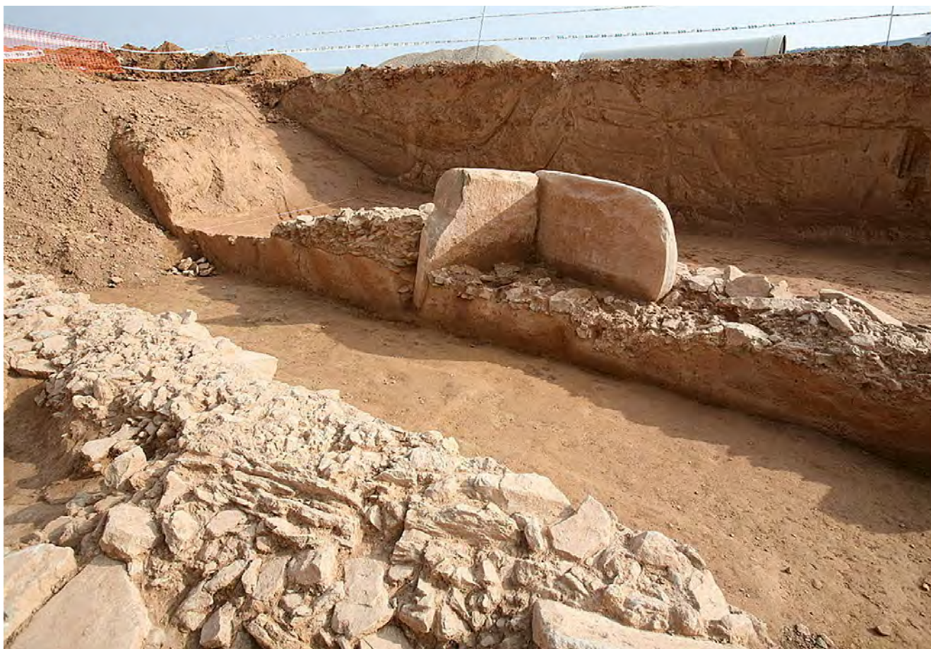
Figura 17. Reguers de Seró, Artesa de Segre. 2007. El dolmen seccionat per la rasa oberta per instal·lar la canonada de reg.

L'excavació extensiva, cambra i túmul, va permetre recuperar les restes d'almenys dos individus i una part significativa de l'aixovar funerari i ofrenes que els acompanyava: vasos ceràmics, alguns dels quals amb decoració d'estil campaniforme pirinenc, campaniforme regional incís i campaniforme epimarítim; una punta de sageta de sílex amb aletes i peduncle; 1 botó piramidal de petxina, decorat i amb perforació en V; una petita dena calcària; i al voltant de 400 denes de petxina ( Cardium edule ) aparegudes completament disperses, a més de restes de quatre animals, cabra i ovella. La datació ra-