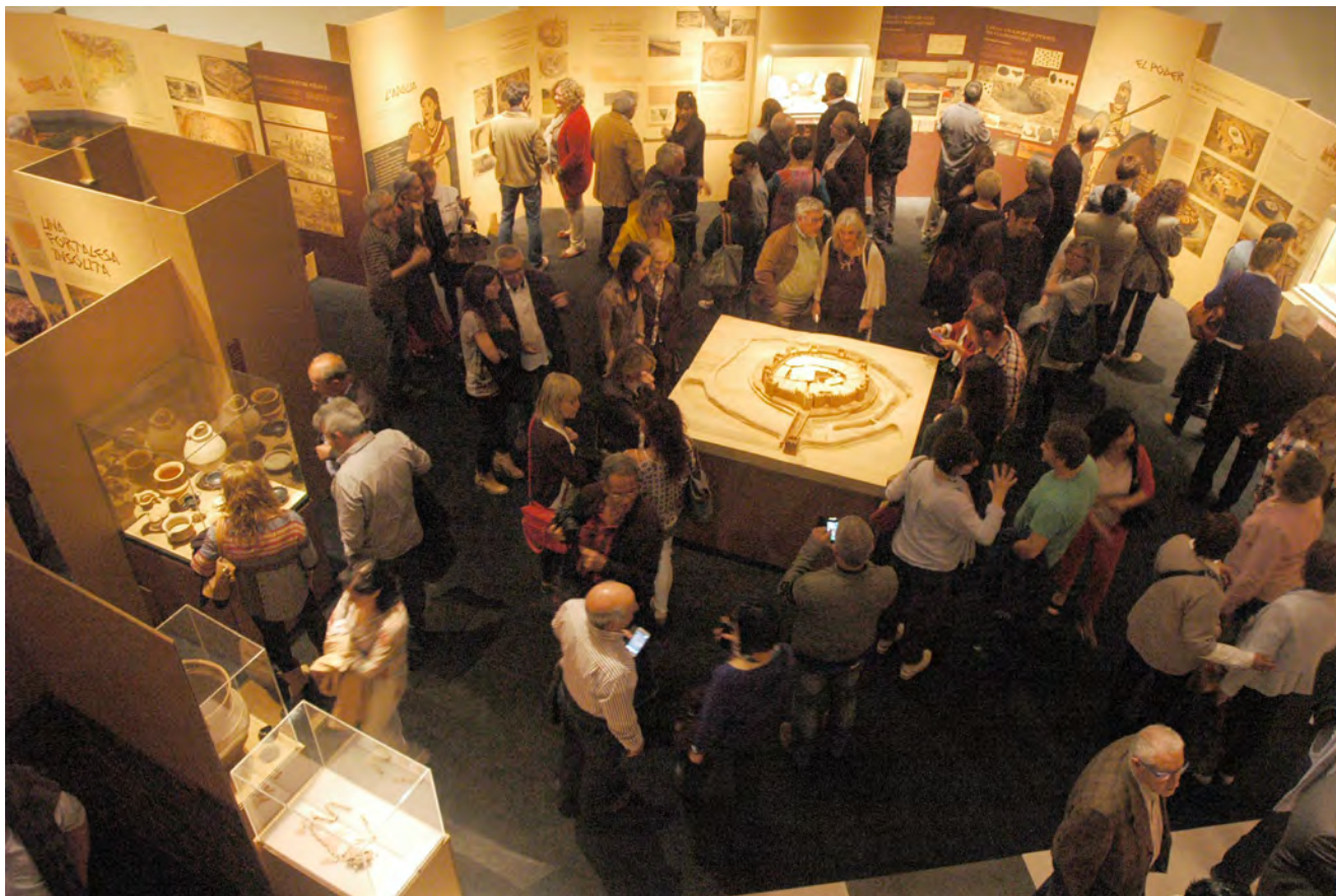
Figura 26. Inauguració de l'exposició "La Fortalesa dels Vilars d'Arbeca. Terra, aigua i poder en el món iber" al Museu de Lleida. Maig 2016.

i estreta porta; s'alterà greument el discurs expositiu: la informació genèrica sobre el món iber passà a un costat, la introductòria referida a la història de la recerca i la recuperació patrimonial al final, a la sortida, de manera que els panells quedaven ordenats en direcció contrària (figura 27).