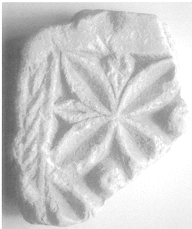
Fig. 1. Fragment de cancell visigòtic de Lleida, amb decoració per les dues cares.

La peça és de marbre blanc però en ser trobada presentava una pàtina adherida de color marronós. En la restauració, duta a terme al Laboratori d'Arqueologia de la Universitat de Lleida, ha rebut un tractament de neteja, eliminant les restes de terra i concrecions adherides mitjançant procediments químics. Amida 20 x 23,3 x 6,5 cm i conté decoració tallada a bisell per les dues cares. En una d'elles s'hi aprecia perfectament que el fragment es correspon a un dels extrems d'una peça de majors dimensions, perquè una franja en angle recte emmarca la resta de la decoració. En un dels dos costats laterals s'hi distingeix un enfonsament de secció circular que suposem que