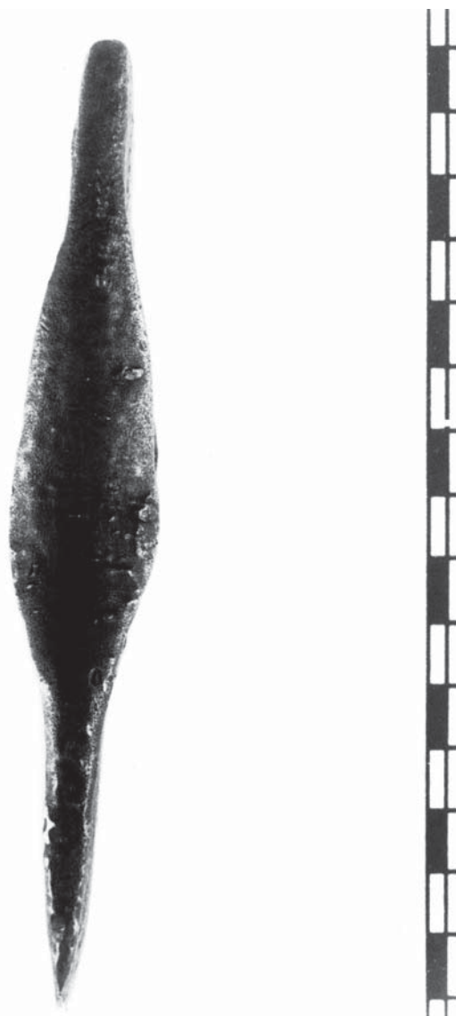
Fig. 3. Visió lateral de la destral mitjançant la qual es poden apreciar les característiques d'un dels vorells que li confereixen personalitat tipològica.