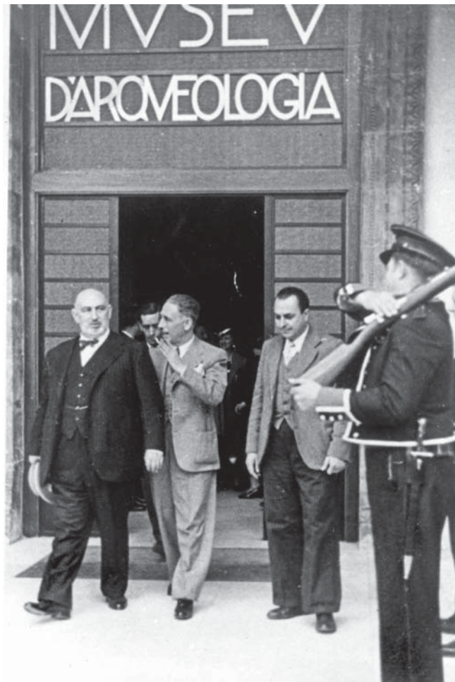
Fig. 1. L'entrada del Museu d'Arqueologia de Catalunya. Barcelona. Visita del president de la Generalitat, Lluís Companys, amb A. Ossorio y Gallardo (2 d'abril de 1936). J. M. Sagarra, repòrter. Còpia paper Arxiu MAC.

Des de ben aviat la Generalitat inicià una política —que resultà en bona part fracassada— amb relació a les obres considerades més valuoses del patrimoni cultural català adreçada a dipositar-les fora de l'Estat espanyol. 8 Resultat d'això fou l'organització, d'acord amb el govern francès, d'una exposició sobre art medieval català al Jeu de Paume de París el 1937 ( Art Catalan du xe au xve siècle ). Les obres varen ser traslladades en concloure l'exposició al castell de Maisons-Laffite, on varen romandre fins la fi de la contesa bèl·lica. 9 No obstant això, altres intents, com el d'enviar en dipòsit més obres a França, cosa per a la qual s'havia elaborat un pla per fer sortir tres camions per dia durant un mes (noranta camions), varen resultar frustats per falta d'enteniment amb el