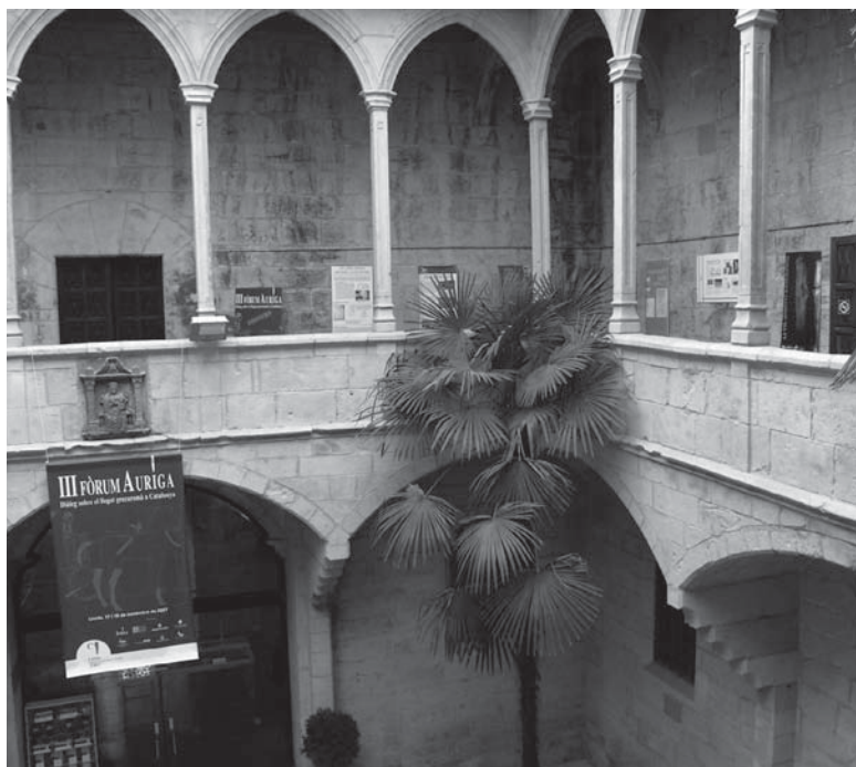
Fig. 2. Els pòsters participants en el III Fòrum Auriga s'exposen en la galeria de l'Institut d'Estudis Ilerdencs