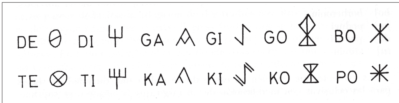
Figura 3. Les dualitats proposades per J. Maluquer (1968: 53).

del plomo, una misma palabra pueda ser notada indistintamente con uno u otro signo no altera la realidad de otros muchos casos. (Maluquer 1968: 53).