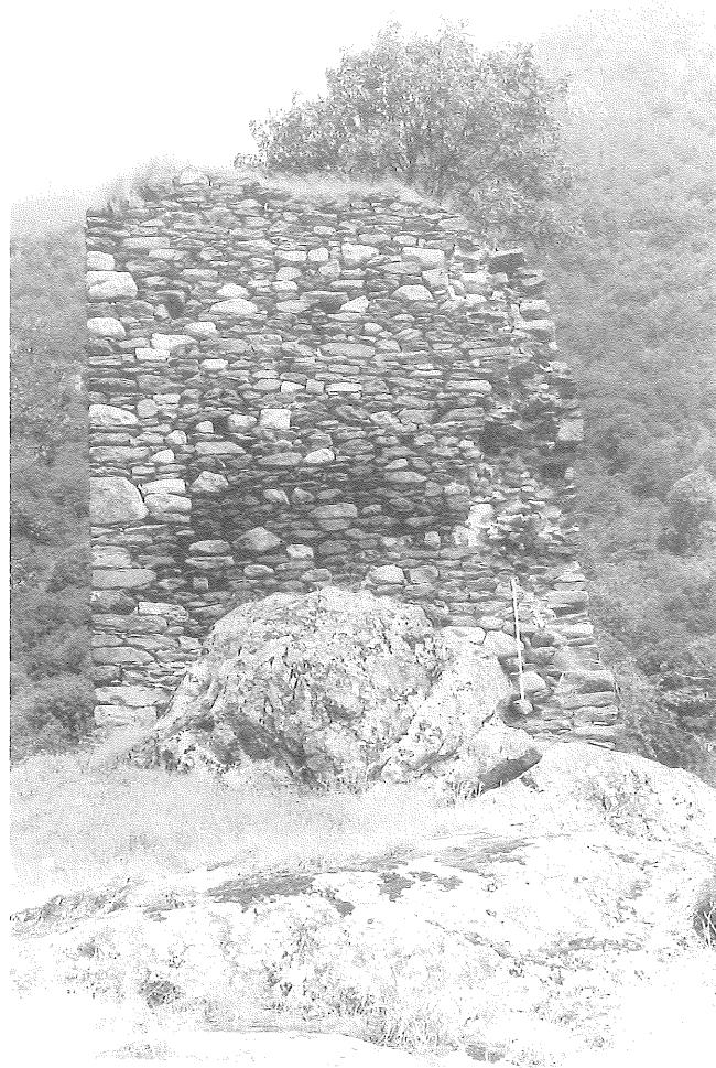
Foto 3. Vista de ponent del Casteret de Les.

Per últim, farem esment del Castet de Les i del Casteret de Les. En el primer, s'han portat a terme una campanya d'excavació al 1994, deixant a la vista diferents etapes cronològiques de l'edifici. Es pot observar, actualment, un bon tros de parament de muralla i una torre quasi sencera. Segons la documentació, aquest castell va ser destruït el segle XVII, durant la Guerra dels Segadors.