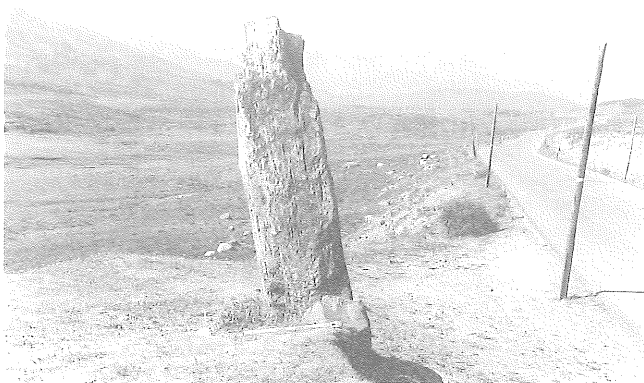
La Peira Arruja.